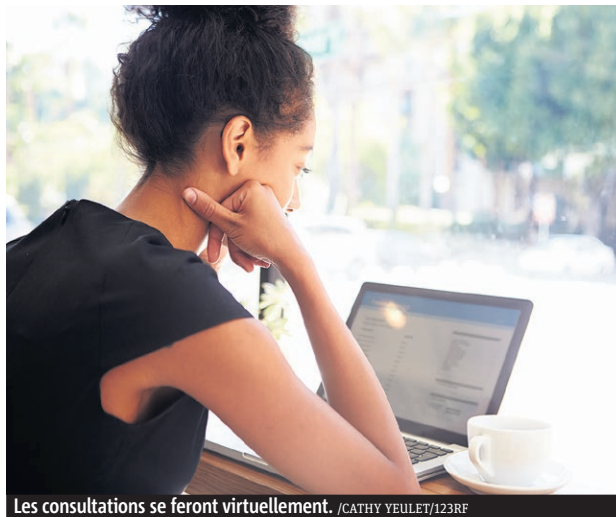
Les consultations se feront virtuellement.

Quatre rencontres où les citoyens seront invités à échanger en direct et à répondre à